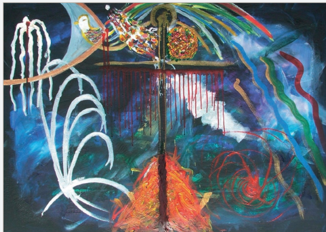
'Mørkets Tårer', der ligger under 'Lysets Tårer' på forsiden.