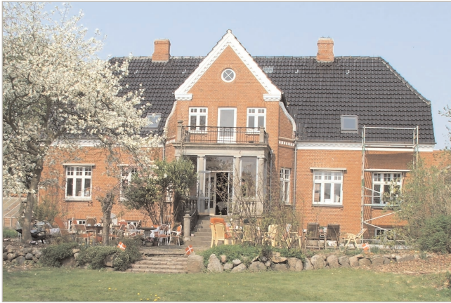
Bjergager Solby ligger i Åsum uden for Odense. Bjergager danner rammen om en eksistentiel proces med at afprøve nye levemåder og føde nye kulturelle impulser.