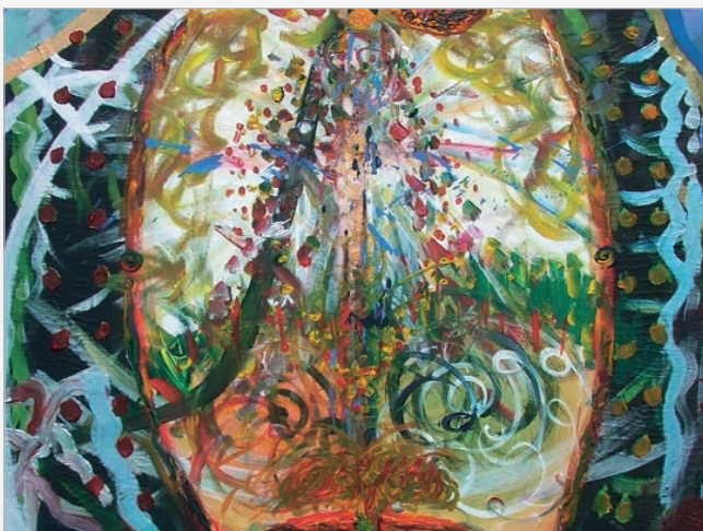
'Lysets Tårer' der ligger ovenpå 'Mørkets Tårer' på forsiden.

Vi lægger vægt på ansvarlighed, troværdighed og ligeværd og på at hvert enkelt menneske må tage selvstændig stilling til livet. På Bjergager er der derfor ingen guruer, autoriteter eller forestillinger, der ikke kan udfordres. Her er ingen færdigpakke løsninger eller nemme opskrifter på succes. Men der ligger en stor erfaring bag, og der er en grund til alt, hvad vi gør.