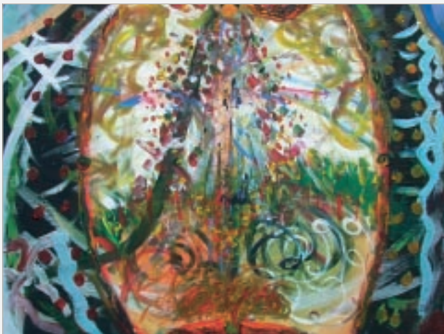
'Lysets Tårer' der ligger ovenpå 'Mørkets Tårer' på forsiden.

Vi lægger vægt på ansvarlighed, troværdighed og ligeværd og på at hvert enkelt menneske må tage selvstændig stilling til livet. På Bjergager er der derfor ingen guruer, autoriteter eller forestillinger, der ikke kan udfordres. Her er ingen færdigpakke løsninger eller nemme opskrifter på succes. Men der ligger en stor erfaring bag, og der er en grund til alt, hvad vi gør.