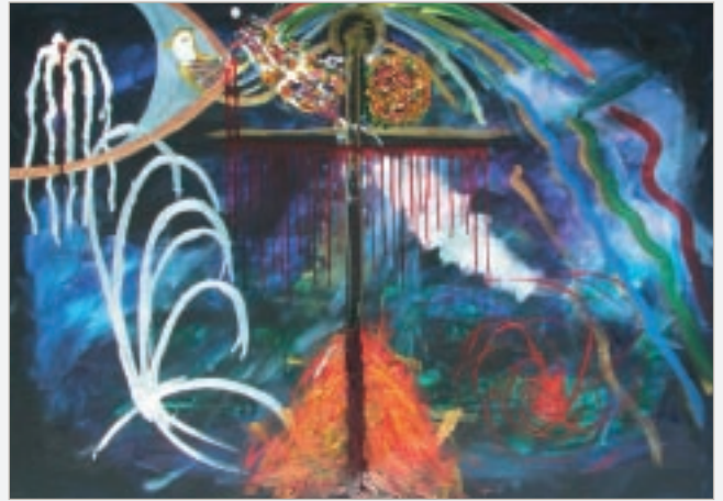
'Mørkets Tårer', der ligger under 'Lysets Tårer' på forsiden.