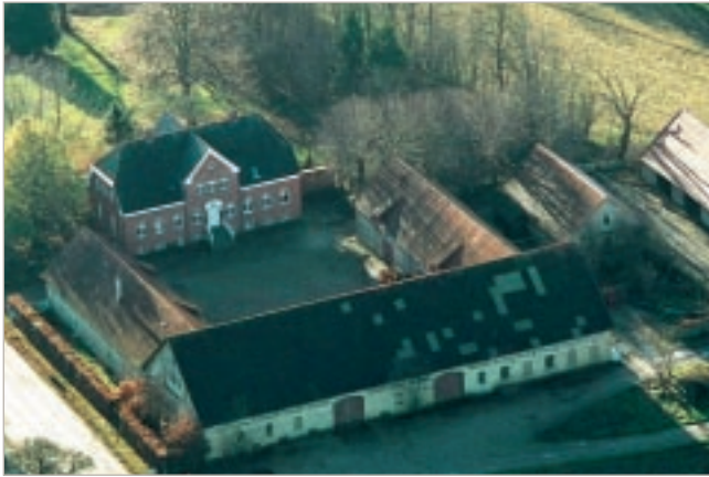
Bjergager Solby ligger i Åsum uden for Odense. Bjergager danner rammen om en eksistentiel proces med at afprøve nye levemåder og føde nye kulturelle impulser.